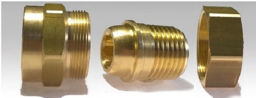
GIUNTO TRE PEZZI NON ASSEMBLATO