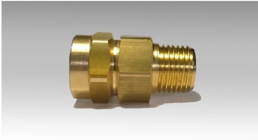
GIUNTO TRE PEZZI ASSEMBLATO